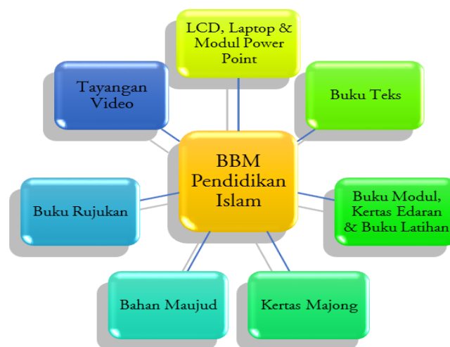
Rajah 1: Model Bahan Bantu Pengajaran Pendidikan Islam

Berdasarkan analisis kajian, pengkaji membina satu model yang dinamakan sebagai Model Bahan Bantu Mengajar Pendidikan Islam. Model ini digambarkan sebagaimana yang terpapar di Rajah 1.